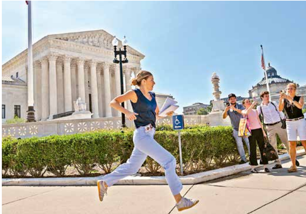
Una reportera corre a las afueras de la Corte Suprema, mientras el tribunal rechazaba el histórico intento del presidente de restringir el derecho a la ciudadanía.