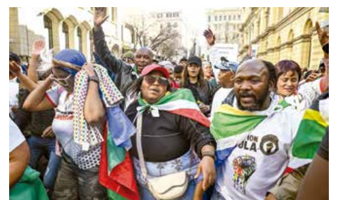
JOHANNESBURGO Y CIUDAD DEL CABO

¡Qué lamentable ver a María Corina Machado utilizando una tragedia nacional como otra plataforma de protagonismo! Pareciera que su lema es: "¿cómo hacer que todo se trate de mí?".