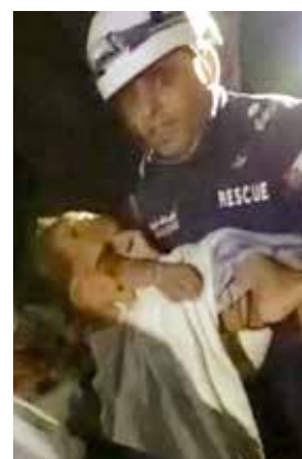
El menor no parecía dar señales de vida.

El niño recibió los primeros auxilios y fue