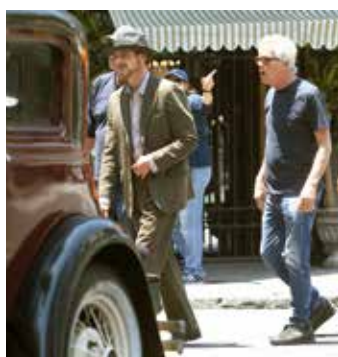
La cinta es dirigida por Todd Haynes.