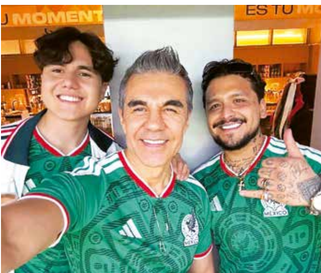
Adrián Uribe, su hijo y Christian Nodal.