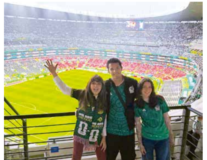
Itatí Cantoral con sus hijos.