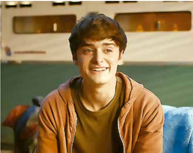
NOAH SCHNAPP