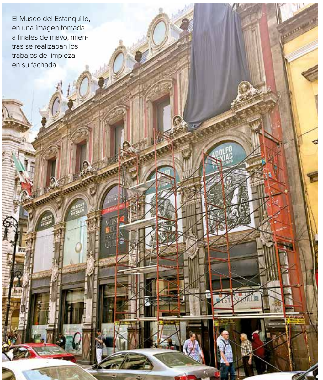
El Museo del Estanquillo, en una imagen tomada a finales de mayo, mientras se realizaban los trabajos de limpieza en su fachada.

“Si la primera siguió una línea cronológica de la historia del país, acá propondremos una lectura a partir del contenido de la colección; es decir, una muestra de cómo