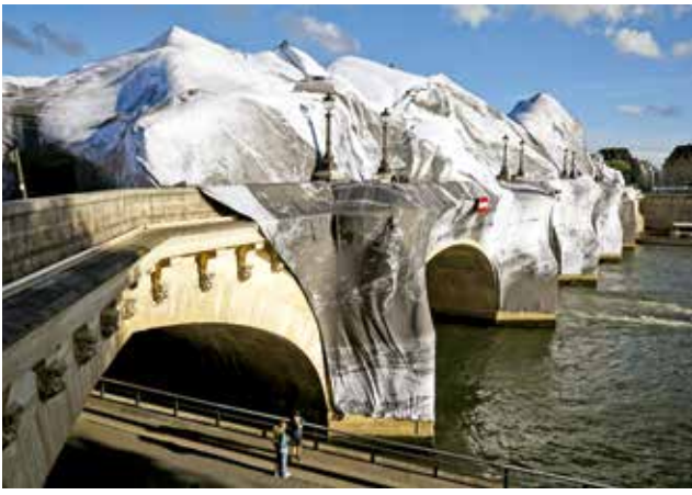
LA CAVERNE DU PONT NEUF