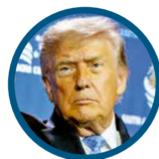
Donald Trump, presidente de Estados Unidos.

"Esperamos que el 1 de julio pase sin más y que Estados Unidos no confirme su deseo de prorrogar el acuerdo", declaró Greta Peisch, consejera general de la USTR, quien advirtió