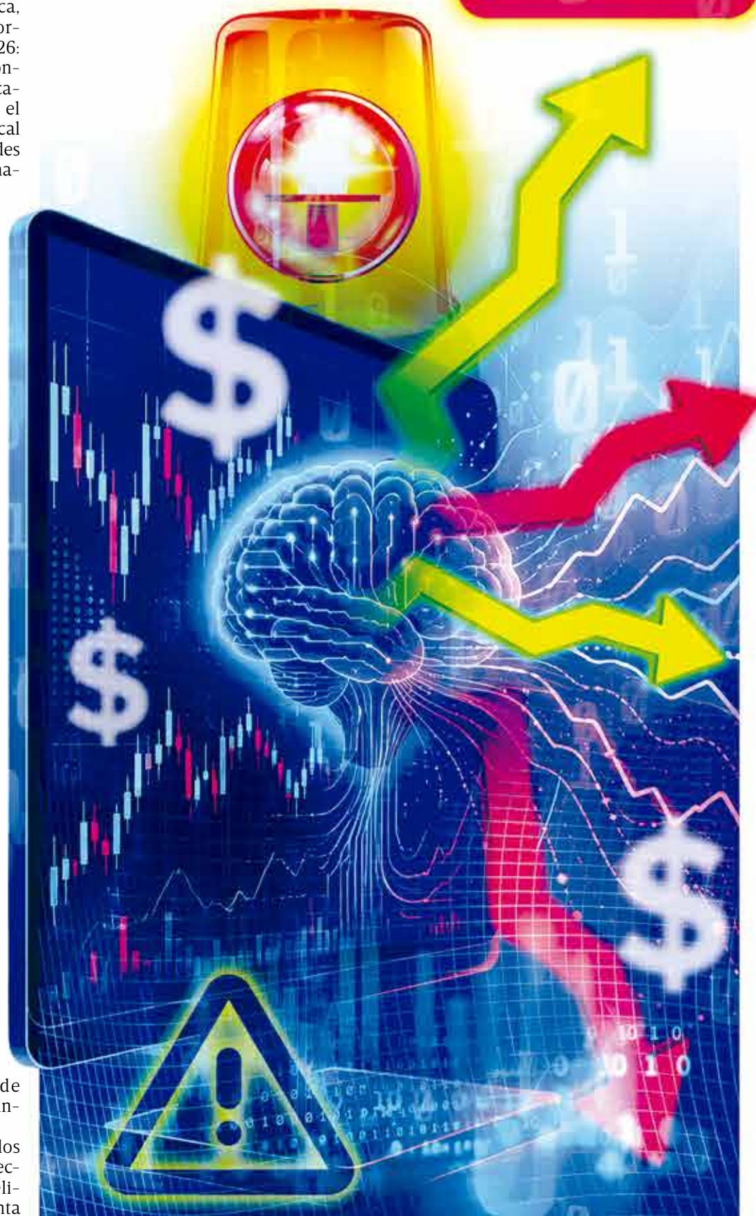
Ilustración: Erick Retana

EL ENDURECIMIENTO DE LAS CONDICIONES para préstamos bancarios y la opacidad en el crédito privado encienden focos rojos en los mercados globales por la alta concentración en firmas de inteligencia artificial