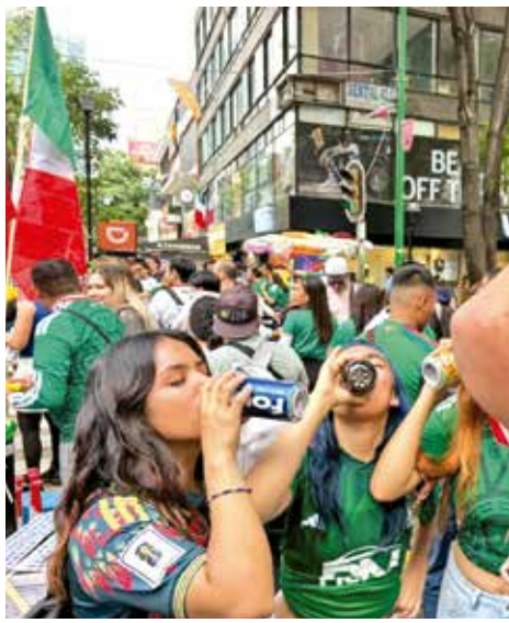
Pese al filtro de seguridad, aficionados lograron ingresar con bebidas alcohólicas