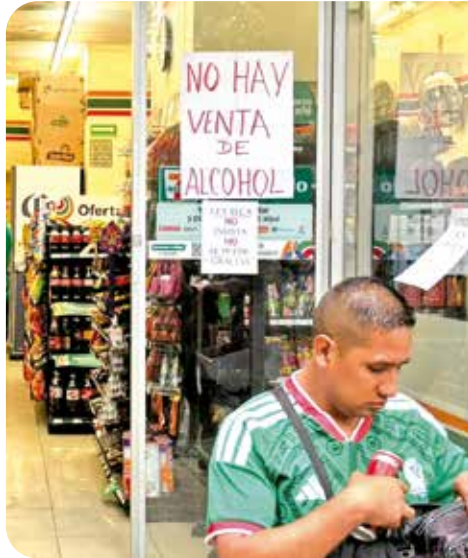
A partir de las 15:00 horas de ayer, tiendas dejaron de vender bebidas alcohólicas.

salieron a las calles a celebrar la victoria.