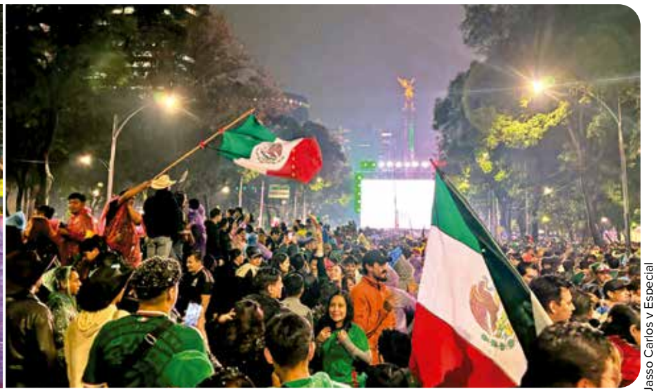
Al término del encuentro deportivo, se aglomeraron alrededor 800 mil personas para celebrar la tercera victoria consecutiva de México en el Mundial.