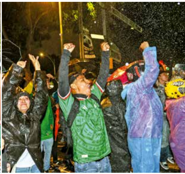
Miles de aficionados celebraron los tres goles de la Selección Mexicana, pese a la lluvia.