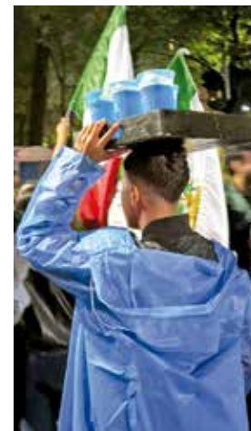
Durante los festejos, la venta de bebidas alcohólicas preparadas también se hizo presente.

En Tlalpan, la alcaldesa Gabriela Osorio compartió en redes el video de la celebración del tercer gol desde el Deportivo Vivanco, donde se observó a chicos y grandes emocionados.