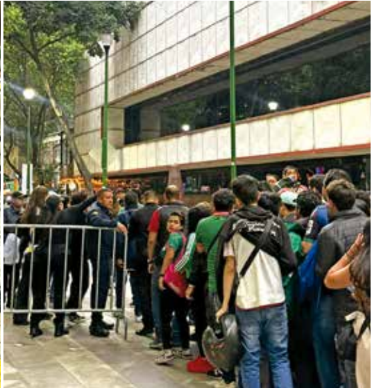
Largas filas fueron reportadas en distintos puntos para acceder a ver el partido.