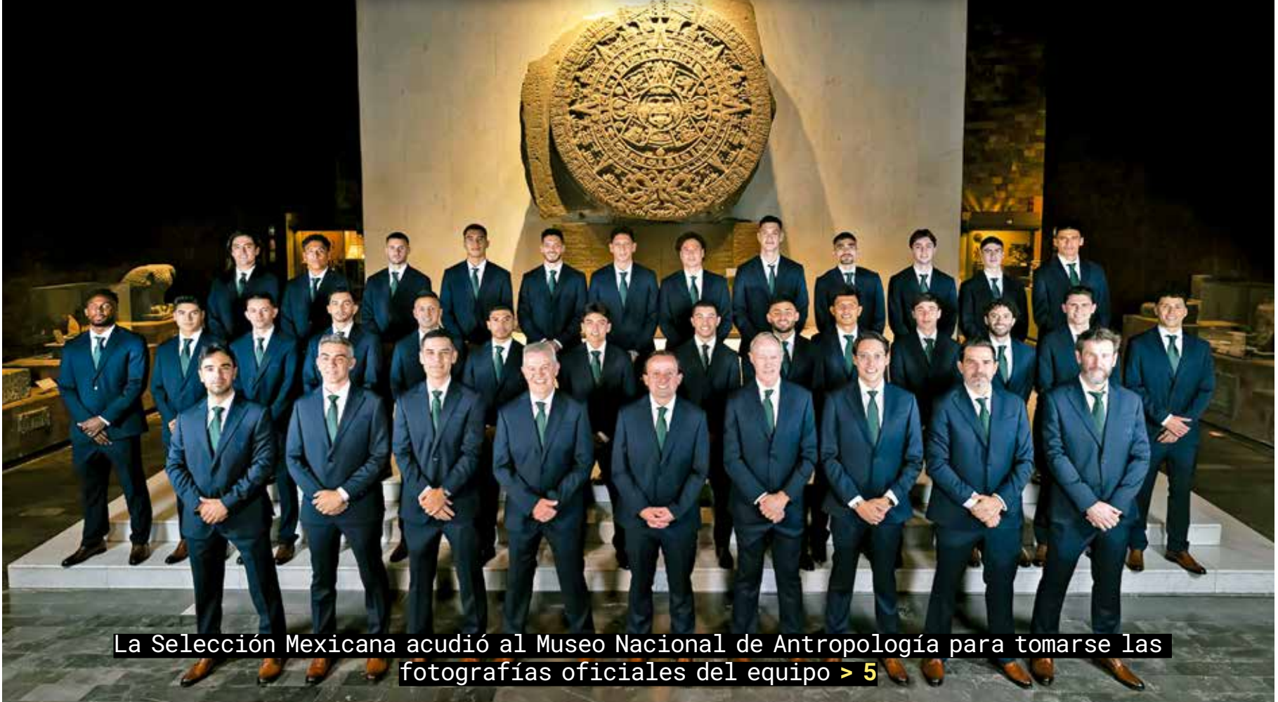
La Selección Mexicana acudió al Museo Nacional de Antropología para tomarse las fotografías oficiales del equipo > 5