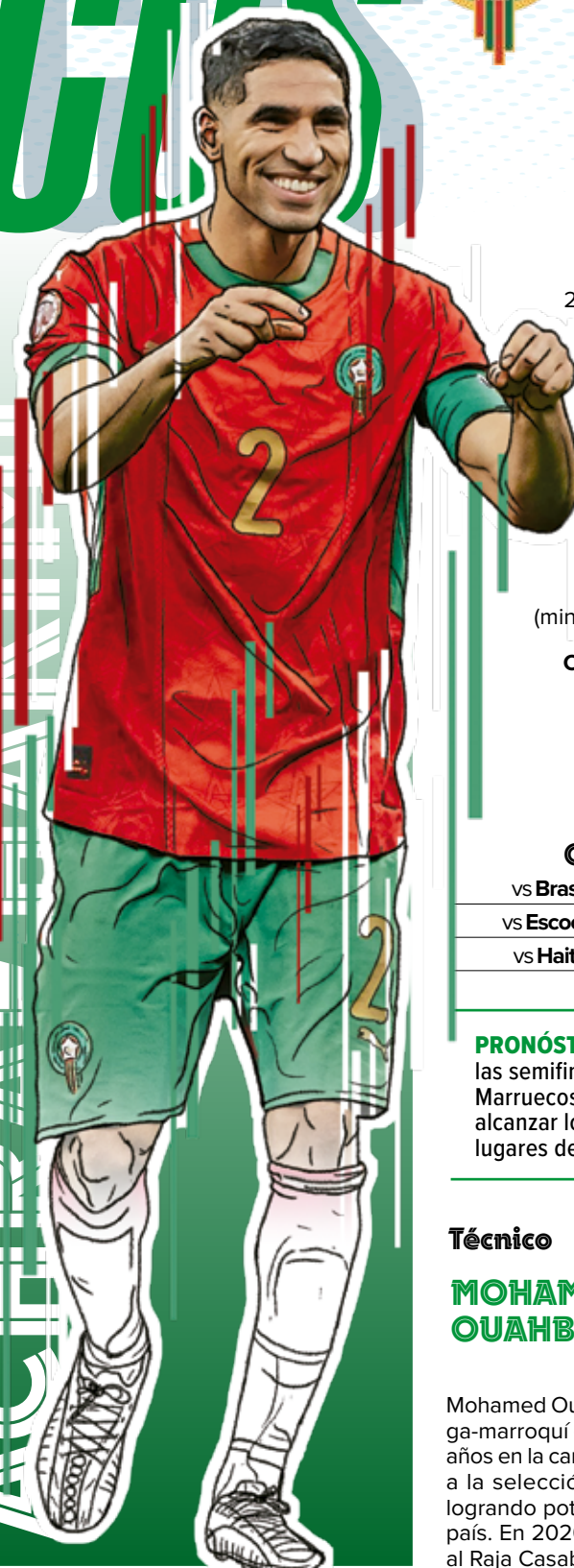
Arte: Erick Retana