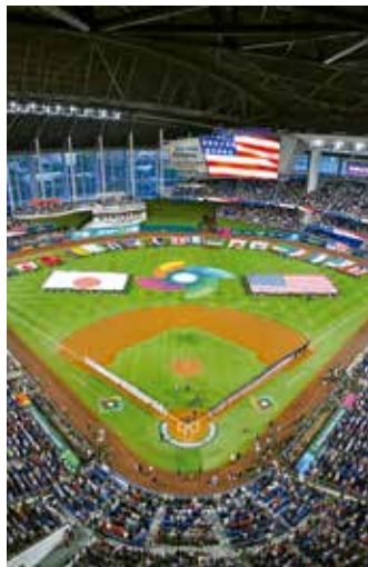
El Clásico Mundial 2026 tendrá su final en Miami.

Con un equipo poderoso, el conjunto nipón tiene todo para dar la pelea en el torneo, que la primera fase la jugará en casa.